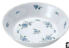
⑨ ビューティフラワー サラダボール BF-5 A