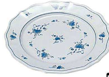
③ ビューティフラワー 平皿19cm BF-2 A