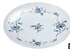
⑪ ビューティフラワー ライス皿 BF-6 A