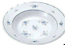
⑦ ビューティフラワー スープ皿 BF-8 A