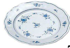
④ ビューティフラワー パン皿 BF-1 A