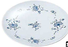
⑫ ビューティフラワー ケーキ皿 BF-7 A