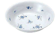
⑧ ビューティフラワー グープ皿 BF-31 A