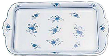
⑬ ビューティフラワー角皿 A