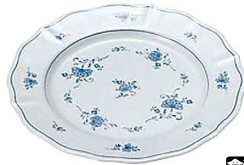
② ビューティフラワー ミート皿 BF-3 A