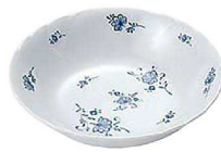
⑩ ビューティフラワー ベリー皿 BF-4 A