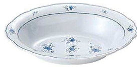
⑥ ビューティフラワー ベーカー皿 BF-9 A