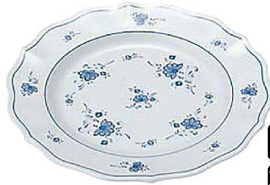
① ビューティフラワー 平皿27cm BF-30 A

ブルー色の親しみやすい花のデザイン 材質：メラミン ●耐熱温度 120℃ ※電子レンジ 使用不可