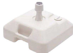
⑱ 注水型マルチのぼりスタンド H 日本 商品コード 規格 外寸縦×横×高さmm 注文コード 標準価格 433082 20 430×430×H280 07-0608-1801 ¥3,200 材質/ポリウレタン