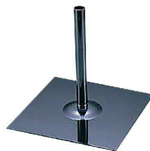
⑰ のぼり竿用スタンド 商品コード 規格 外寸縦×横×高さmm 注文コード 標準価格 433018 小 300×300×H420 07-0608-1701 ¥7,100 433017 大 450×450×H420 07-0608-1702 ¥9,400 材質/スチール