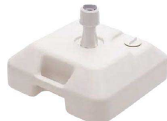
⑱ 注水型マルチのぼりスタンド H 商品コード 規格 外寸縦×横×高さmm 注文コード 標準価格 433082 20 430×430×H280 07-0608-1801 ¥2,700 材質/ポリウレタン