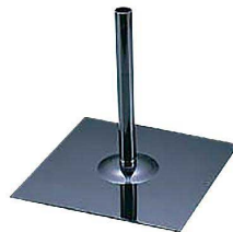
⑰ のぼり竿用スタンド 日本 商品コード 規格 外寸縦×横×高さmm 注文コード 標準価格 433018 小 300×300×H420 07-0608-1701 ¥7,500 433017 大 450×450×H420 07-0608-1702 ¥9,900 材質/スチール