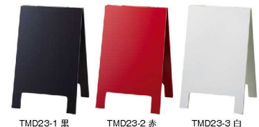
TMD23-1 黒 TMD23-2 赤 TMD23-3 白