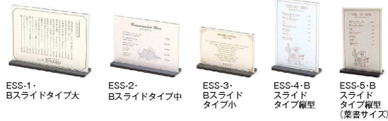
ESS-1・Bスライドタイプ大 ESS-2・Bスライドタイプ中 ESS-3・Bスライドタイプ小 ESS-4・Bスライドタイプ縦型 ESS-5・Bスライドタイプ縦型(葉書サイズ)