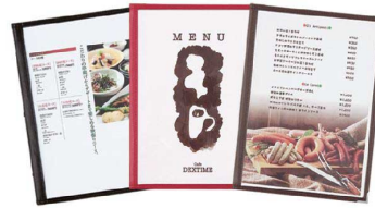
黒 赤 茶

スリムバインダーメニューブック 新開発の12mm幅バインダーで、スリムなメニューブックになりました。 ●A4 6ページ仕様 10枚20ページまで増減可 ●付属パーツ:ビニールG3