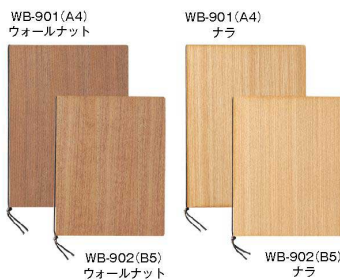
WB-901(A4)ウォールナット WB-901(A4)ナラ WB-902(B5)ウォールナット WB-902(B5)ナラ

スリムバインダーメニューブック 新開発の12mm幅バインダーで、スリムなメニューブックになりました。 ●A4 6ページ仕様 10枚20ページまで増減可 ●付属パーツ:ビニールG3