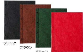
ブラック ブラウン グリーン エンジ