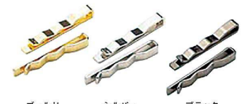
ゴールド シルバー ブラック