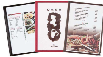
黒 赤 茶