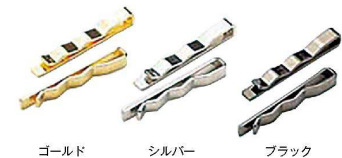
ゴールド シルバー ブラック