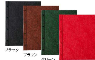
ブラック ブラウン グリーン エンジ