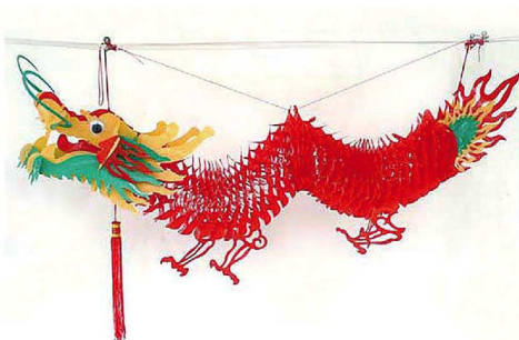
⑧ ラッキードラゴン 赤 1m ★納運