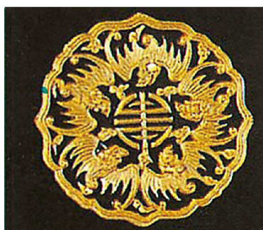
④ 五福円盤 ★納運