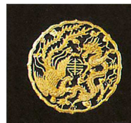
③ 龍と鳳円盤 ★納運