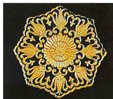
⑥ 花の円盤 ★納運