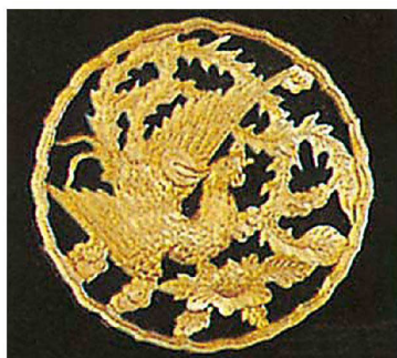
② 鳳凰円盤 ★納運