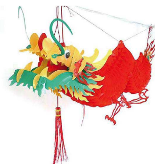
⑨ ラッキードラゴン 赤 1.4m ★納運