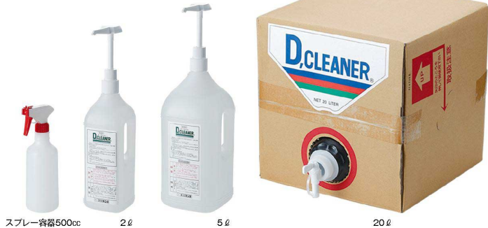
スプレー容器500cc 2ℓ 5ℓ 20ℓ