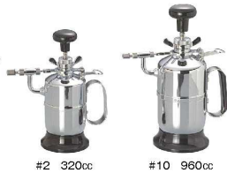
#2 320cc #10 960cc