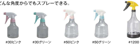
#30ピンク #30グリーン #50ピンク #50グリーン #1200

上向きでも、下向きでも、横向きでも、逆さ向きでも、 どんな角度からでもスプレーできる。