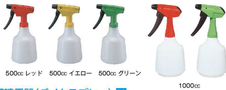
500cc レッド 500cc イエロー 500cc グリーン 1000cc