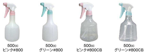
500cc ピンク#800 500cc グリーン#800 500cc ピンク#800CB 500cc グリーン#800CB