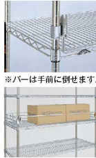
※バーは手前に倒れます。

物品の落下を防止する、取り外し可能な器具。手前に倒せる設計によって、物品の出し入れがスムーズに行えます。バーはSUS304ステンレス製。取付け金具はアルミ製。