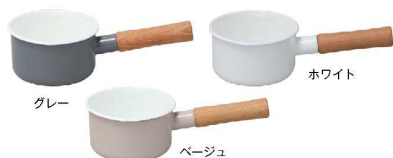
グレー ホワイト ベージュ