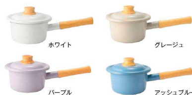
ホワイト グレージュ パープル アッシュブルー