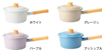
ホワイト グレージュ パープル アッシュブルー