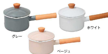
グレー ホワイト ベージュ