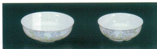
M-208-H 浅鉢 134×42(375ml) ¥860