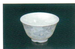
M-314-H 湯呑 95×56(190ml) ¥590 ●