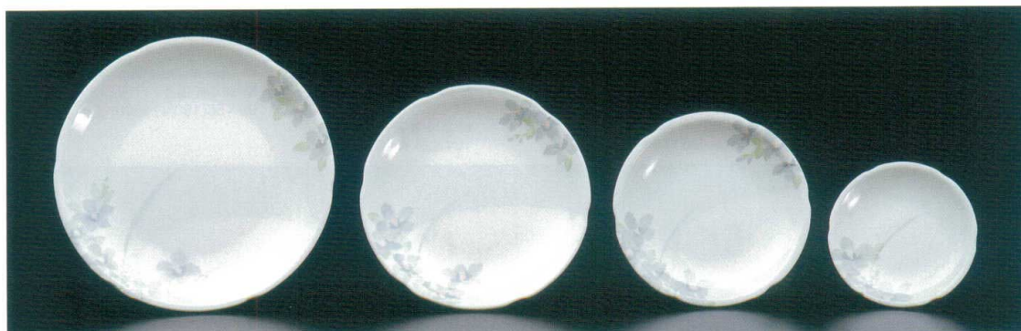
M-327-H 丸皿 224×31 ¥1,470 ● ㄣK-100 P81 ¥500