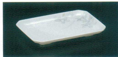
M-341-H 角皿 202×135×23 ¥1,120 ● ㄣK-270 P81 ¥530