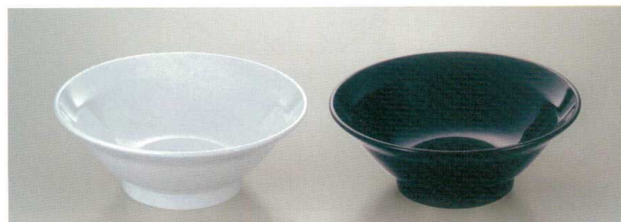
M-59 エコ丼 210×78 ホワイト・ブラック ¥1,510 容量: すり切り1,050ml くびれ線まで625ml ※外径はM-57(P25参照)と同形状です。

スープの絶対量を減せるので、塩分脂肪分が気になるお客さまにヘルシーメニューを提供できます。