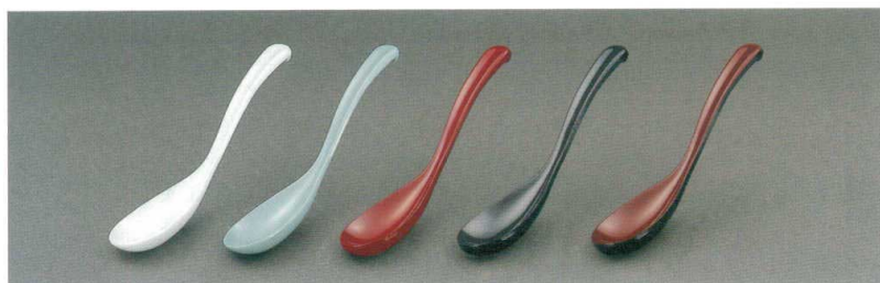
M-590 チリレンゲ 171×43 白・青磁・朱・黒 ¥160