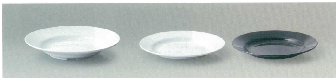
M-40 スープ皿 230×38(810ml) ¥750 ▲