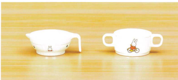
M-1320C すり鉢 139×108×46(240ml) ¥860