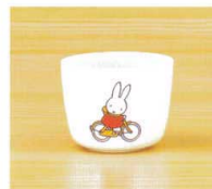
CM-11C 湯呑 76×60(180ml) ¥500