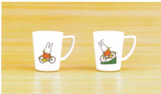
M-1302C1 モーニングカップ 73×88(230ml) ¥820