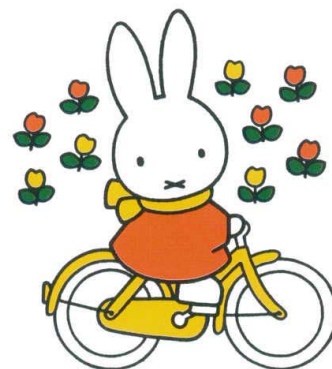
M-1330C 両手付カップ 94×50(250ml) ¥970