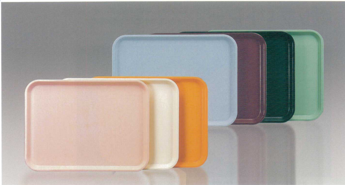
H-87 長手盆(シボ付) 427×313×20 ピンク・アイボリー・オレンジ・ブルー・溜色・黒・青磁 ¥1,900