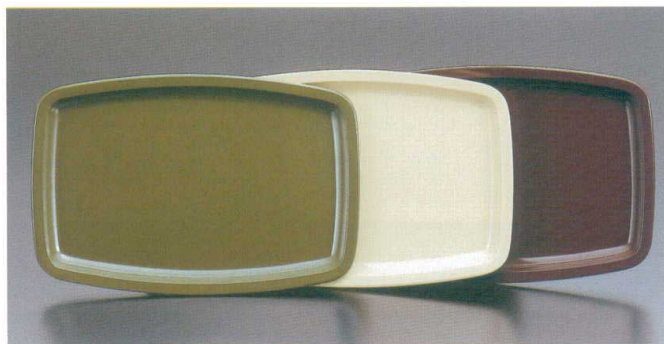
M-160 スナックトレイ 258×173×18 グリーン・アイボリー・ブラウン メラミン樹脂 ¥1,130