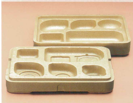
Z-315 お食事便 462×343×132ゴールド 発泡スチロール ¥4,040