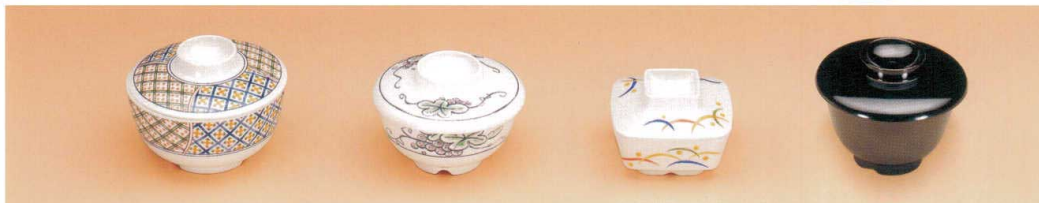
W-101-TK 飯椀(身) 112×60(350ml) ¥940 W-102-TK 飯椀(蓋) 112×30 ¥740