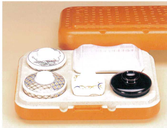
セット価格 ¥15,620 ケース重量:約500g 総重量(食器セット時):約1,300g