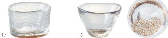
硝子金彩珍味入 切立 17 (26437) 580円 約φ6×H4cm ※小箱20ヶ入