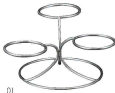
01 小付三種リングベース 01 (29000) 1,100円 約11.9×11×H6.4cm (リング内径 約φ4.5cm) ※ステンレス製