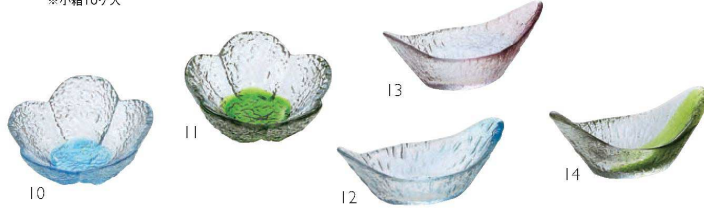
硝子ミニ小付 花舞 10 (26862) 若水 420円 11 (26864) 若草 420円 約8.5×8.5×H3.4cm ※小箱10ヶ入