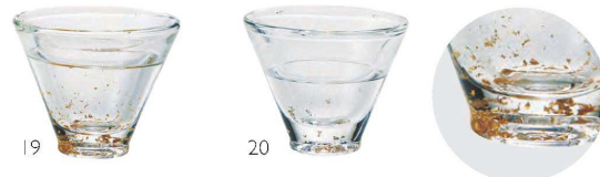
二層硝子 ゆらり盃 19 (27900) 金 1,900円 20 (27901) 銀 1,700円 約φ6×H5cm 容量：満約40ml ※食洗機不可 ※耐熱ではありません。 ※水の量はバラつきがございます。