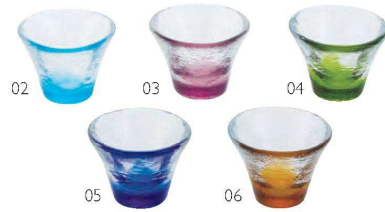
硝子ミニ珍味入 反り丸 02 (26856) 若水 420円 05 (26598) 瑠璃(ミリ) 420円 03 (26857) 浅紫 420円 06 (26599) 琥珀(コハク) 420円 04 (26858) 若草 420円 約φ5.5×H4cm ※小箱20ヶ入