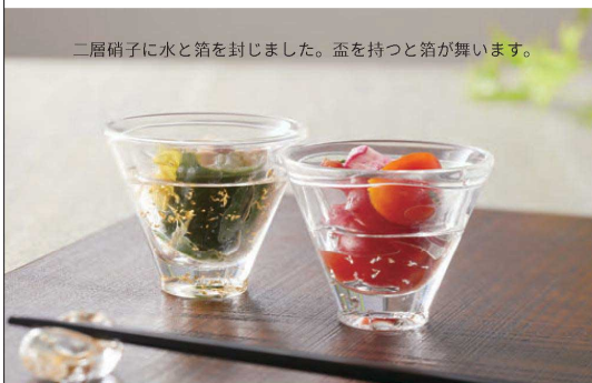
硝子金彩珍味入 変形 18 (26438) 580円 約φ6.5×H4.6cm ※小箱20ヶ入