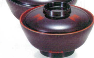
⑧ 大亀甲椀 黒内朱 1-190-9 蓋 111φ×37(200)52g ¥500 1-190-9A 身 [O-JW-45] 120φ×90(200)300ml 82g ¥750