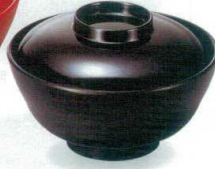
㉑ カスミ汁椀 黒 W-141-74-B 蓋 110φ×25(200)40g ¥420 W-140-74-B 身 [MW-14B] 120φ×58(200)330ml 82g ¥540