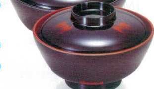
⑧ 大亀甲椀 黒内朱 1-190-9 蓋 111φ×37(200)52g ¥500 1-190-9A 身 [O-JW-45] 120φ×90(200)300ml 82g ¥750