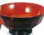
⑮ 1-190-16 新亀甲汁椀 黒内朱 118φ×56(300)310ml 67g ¥600