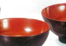
⑭ 1-190-14 3.8寸汁椀 黒内朱 [F-66] 112φ×52(300)290ml 62g ¥600