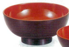
⑩ 1-190-10 4.0歳高椀 黒内朱 [F-80] 120φ×55(300)350ml 65g ¥600