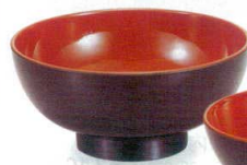
⑩ 1-190-10 4.0歳高椀 黒内朱 [F-80] 120φ×55(300)350ml 65g ¥600