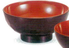
⑬ 1-190-13 3.8亀甲椀 黒内朱 [F-43] 115φ×55(300)300ml 64g ¥600