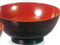
⑫ 1-190-12 3.8寸筋入椀 黒内朱 [F-68] 115φ×54(300)320ml 47g ¥600