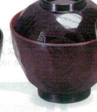
⑱ W-21-7 一口亀甲椀 黒 蓋 86φ×34(200)29g ¥400 身 [O-JW-46] 90φ×67(200)190ml 80g ¥600