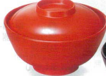
⑳ カスミ汁椀 赤 W-141-74-R 蓋 110φ×25(200)40g ¥420 W-140-74-R 身 [MW-14R] 120φ×58(200)330ml 82g ¥540