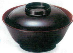
⑥ かすみ椀 曙 1-190-7-A 蓋 110φ×29(200)24g ¥360 1-190-7 身 [F-55] 117φ×75(200)260ml 62g ¥410