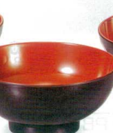
⑭ 1-190-14 3.8寸汁椀 黒内朱 [F-66] 112φ×52(300)290ml 62g ¥600