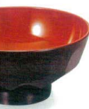
⑮ 1-190-16 新亀甲汁椀 黒内朱 118φ×56(300)310ml 67g ¥600