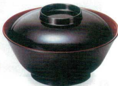
⑥ かすみ椀 曙 1-190-7-A 蓋 110φ×29(200)24g ¥360 1-190-7 身 [F-55] 117φ×75(200)260ml 62g ¥410