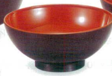
⑪ 1-190-11 4寸椀 黒内朱 [F-70] 120φ×53(300)330ml 54g ¥600