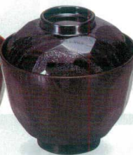
⑰ 1-191-11 高台亀甲吸物椀 黒内朱 蓋 97φ×37(200)43g ¥470 身 [O-JW-47] 108φ×74(200)250ml 85g ¥710