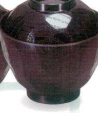
⑲ W-21-8 高台亀甲吸物椀 黒 蓋 97φ×37(200)43g ¥440 身 [O-JW-47] 108φ×74(200)250ml 85g ¥670