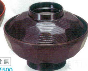
⑨ 大亀甲椀 黒 W-21-5 蓋 111φ×37(200)52g ¥450 W-21-6 身 [O-JW-45] 120φ×90(200)300ml 82g ¥700