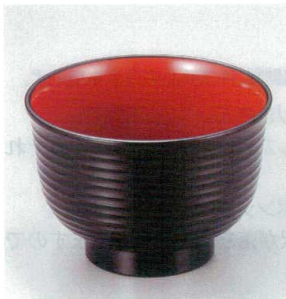
① PET W-11-58 3.3寸美里荒筋汁椀 黒内朱 100φ×69(200)210ml 87g ¥520