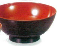
⑫ 1-190-12 3.8寸筋入椀 黒内朱 [F-68] 115φ×54(300)320ml 47g ¥600