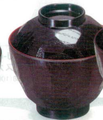
⑰ 1-191-11 高台亀甲吸物椀 黒内朱 蓋 97φ×37(200)43g ¥470 身 [O-JW-47] 108φ×74(200)250ml 85g ¥710