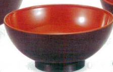
⑪ 1-190-11 4寸椀 黒内朱 [F-70] 120φ×53(300)330ml 54g ¥600