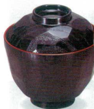
⑯ 1-191-10 一口亀甲椀 黒内朱 蓋 86φ×34(200)29g ¥470 身 [O-JW-46] 90φ×67(200)190ml 80g ¥640