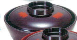
⑦ かすみ椀 曙内朱 1-190-8-A 蓋 110φ×29(200)24g ¥500 1-190-8 身 [F-58] 117φ×75(200)260ml 62g ¥580