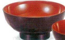
⑬ 1-190-13 3.8亀甲椀 黒内朱 [F-43] 115φ×55(300)300ml 64g ¥600