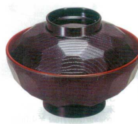
⑨ 大亀甲椀 黒 W-21-5 蓋 111φ×37(200)52g ¥450 W-21-6 身 [O-JW-45] 120φ×90(200)300ml 82g ¥700