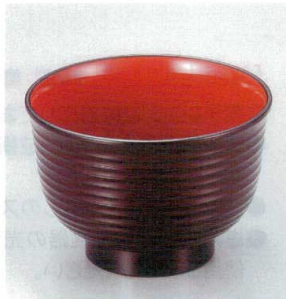
② PET W-19-10 3.3寸美里荒筋汁椀 溜内朱 100φ×69(200)210ml 87g ¥630