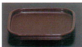
⑩ F-91-16-6 角型カスター台 ブラウン [OF-9] 163×163×19(100) ¥880