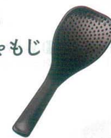
⑲ W-8-13 [P.P] エンボスしゃもじ 黒 157×56×10(300) ¥230