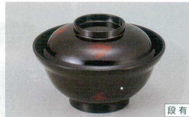
④ 4.7寸飯丼 曙 [F-155] 1-192-14A 蓋 55g ¥550 1-192-14 身 143φ×90(80)350mℓ 101g ¥840