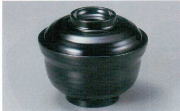
① W-145-4-8 黒木目碗(身) H-JW-145A 111φ×66(120)220mℓ ¥860 ② W-146-4-8 黒木目碗(蓋) H-JW-146A 103φ×37(180) ¥660