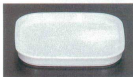
⑪ F-92-16-6 角型カスター台 アイボリー [OF-9] 163×163×19(100) ¥880