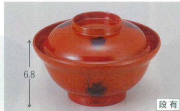
③ 4.7寸飯丼 根来 [F-155] 1-192-13A 蓋 55g ¥500 1-192-13 身 143φ×90(80)350mℓ 101g ¥750