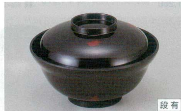
⑥ 5寸飯丼 曙 [F-154] 1-192-16A 蓋 60g ¥570 1-192-16 身 155φ×100(80)470mℓ 131g ¥850