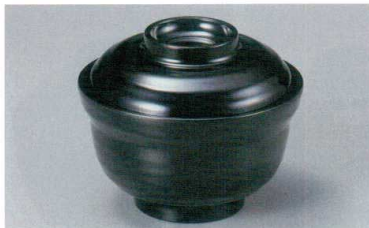
① W-145-4-8 黒木目碗(身) H-JW-145A 111φ×66(120)220mℓ ¥860 ② W-146-4-8 黒木目碗(蓋) H-JW-146A 103φ×37(180) ¥660