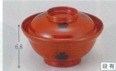
③ 4.7寸飯丼 根来 [F-155] 1-192-13A 蓋 55g ¥500 1-192-13 身 143φ×90(80)350mℓ 101g ¥750