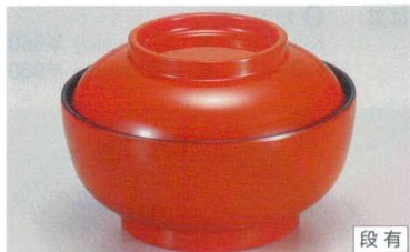
⑧ 5寸丸丼重 朱内黒 [O-JW-310B] 1-192-18A 蓋 106g ¥1,450 1-192-18 身 150φ×102(60)600mℓ 207g ¥1,850