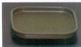
⑫ F-93-16-6 角型カスター台 グリーン [OF-9] 163×163×19(100) ¥880