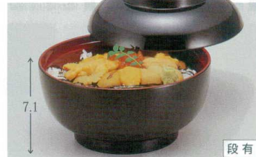
⑦ 5寸丸丼重 黒内朱 [O-JW-310A] 1-192-17A 蓋 106g ¥1,450 1-192-17 身 150φ×102(60)600mℓ 207g ¥1,850