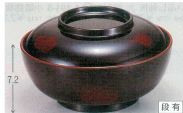
⑨ 6寸丸丼重 曙内朱 [F-320] 1-192-19A 蓋 141g ¥1,650 1-192-19 身 179φ×104(60)950mℓ 210g ¥2,200 2,000