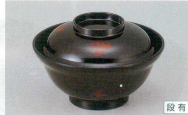
④ 4.7寸飯丼 曙 [F-155] 1-192-14A 蓋 55g ¥550 1-192-14 身 143φ×90(80)350mℓ 101g ¥840