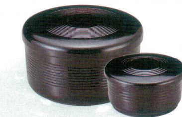
[F] 1人用飯器 [F-120] 130φ×70(80)700mℓ ⑬ 1-232-1 (身) ¥620 ⑰ 1-232-3 (身) ¥1,700 ⑭ 1-232-1A (蓋) ¥400 ⑱ 1-232-4 (身) ¥2,250 [F] 2人用飯器 [F-122] 160φ×90(60)1350mℓ ⑯ 1-232-2A (蓋) ¥680 [F] 3人用飯器 [F-124] 190φ×110(40)2300mℓ ⑲ 1-232-3A (蓋) ¥1,250 [F] 5人用飯器 [F-126] 220φ×135(20)4000mℓ ⑳ 1-232-4A (蓋) ¥1,150