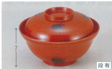
⑤ 5寸飯丼 根来 [F-154] 1-192-15A 蓋 60g ¥570 1-192-15 身 155φ×100(80)470mℓ 131g ¥850