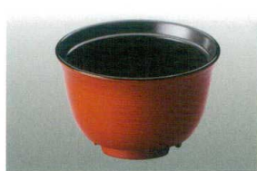
⑨ MT J-102-30 極耐熱 汁椀(小)(身)春慶内黒 WB-12 96φ×62 150ml ¥1,450