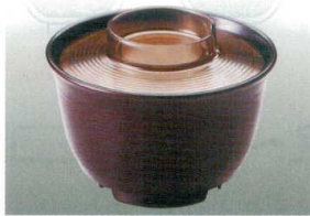
① MT J-102-25 極耐熱 汁椀(中)(身)溜内黒 WB-11 106φ×66 200ml ¥1,500