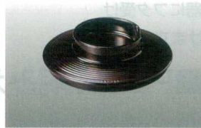
③ MT J-102-27 極耐熱 94汁椀(蓋)溜内黒 WBF-11 94φ×26 ¥950