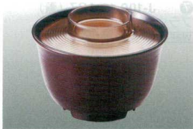
⑥ MT J-102-26 極耐熱 汁椀(小)(身)溜内黒 WB-12 96φ×62 150ml ¥1,450