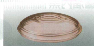
⑫ PC J-100-27 ドーム154(蓋)ブラウン WSF-1 154φ×43 ¥750