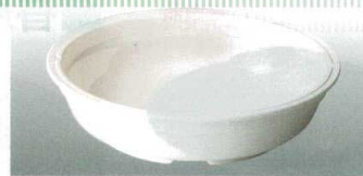
⑪ MT J-102-57 極耐熱 主菜皿(丸型)(身)アイボリー WS-1 163φ×40 ¥1,450