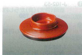
⑩ MT J-102-32 極耐熱 87汁椀(蓋)春慶内黒 WBF-12 87φ×25 ¥900