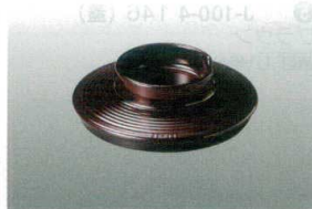
⑧ MT J-102-28 極耐熱 87汁椀(蓋)溜内黒 WBF-12 87φ×25 ¥900