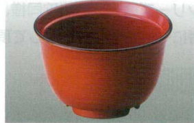
④ MT J-102-29 極耐熱 汁椀(中)(身)春慶内朱 WB-11 106φ×66 200ml ¥1,500