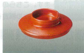
⑤ MT J-102-31 極耐熱 94汁椀(蓋)春慶内朱 WBF-11 94φ×26 ¥950