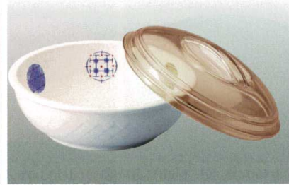
③ J-100-32 ベリー皿(身) かすり [WC-22] 126φ×40 ¥1,200