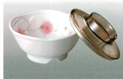
⑧ J-100-35 花形小鉢(身) そよかぜ [WC-20] 107φ×49 ¥1,150