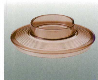
⑮ [PC] J-100-20 94(蓋) ブラウン