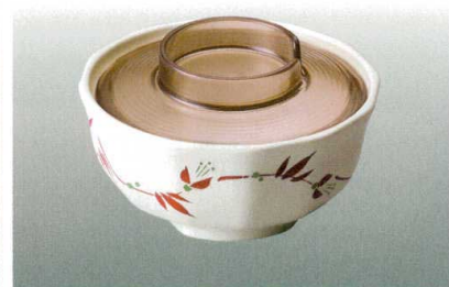
⑬ J-100-37 十二角小鉢(身) つる花 [WC-21] 105φ×48 ¥1,200