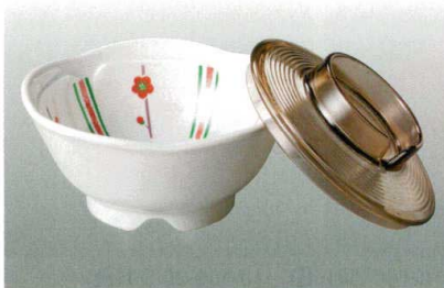
⑥ J-100-34 花形小鉢(身) ほのか [WC-20] 107φ×49 ¥1,150