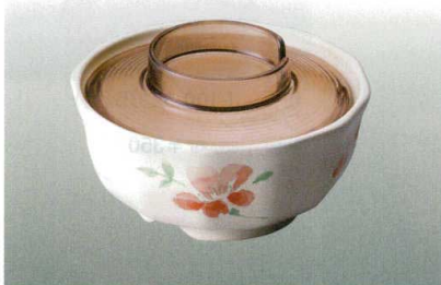
⑪ J-100-36 十二角小鉢(身) 小花 [WC-21] 105φ×48 ¥1,200