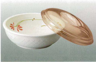
① J-100-31 ベリー皿(身) 野花 [WC-22] 126φ×40 ¥1,200