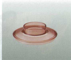
⑭ [PC] J-100-20 94(蓋) ブラウン [WBF-11] 94φ×26 ¥500