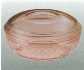
① [PC] J-100-38 ボール(中)(身) ブラウン [WB-41] 120φ×40 300ml ¥720