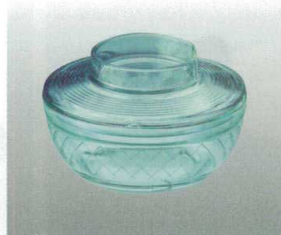
⑩ [PC] J-100-44 ボール(小)(身) グリーン [WB-40] 95φ×40 180ml ¥600