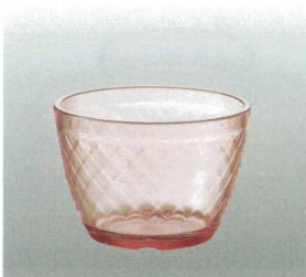
⑮ [PC] J-100-66 デザートボール ブラウン [WB-39] 79φ×55 170ml ¥600