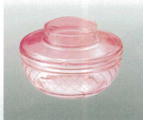
⑫ [PC] J-100-46 ボール(小)(身) ピンク [WB-40] 95φ×40 180ml ¥600