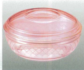
⑤ [PC] J-100-41 ボール(中)(身) ピンク [WB-41] 120φ×40 300ml ¥720