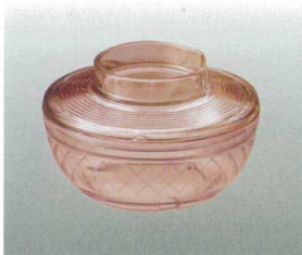
⑧ [PC] J-100-43 ボール(小)(身) ブラウン [WB-40] 95φ×40 180ml ¥600