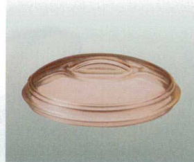
⑦ [PC] J-100-33 ドーム122(蓋) ブラウン [WCF-22] 122φ×33 ¥560