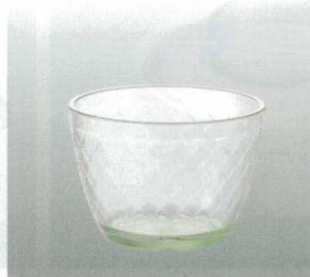
⑯ [PC] J-100-67 デザートボール グリーン [WB-39] 79φ×55 170ml ¥600