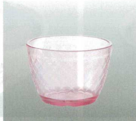
⑰ [PC] J-100-68 デザートボール ピンク [WB-39] 79φ×55 170ml ¥600