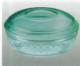
③ [PC] J-100-39 ボール(中)(身) グリーン [WB-41] 120φ×40 300ml ¥720