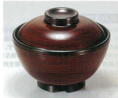
④ TA 溜刷毛目内黒セット S-1-11 (蓋) ¥5,200 (身) ¥2,100 ¥3,100