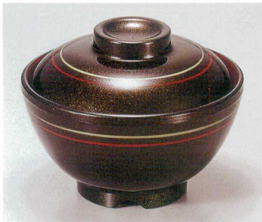
⑤ TA 茶パール朱金ライン内朱セット S-1-22 (蓋) ¥5,300 (身) ¥2,100 ¥3,200