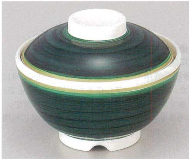
② TA 清流内ストーンセット S-1-7 (蓋) ¥4,600 (身) ¥1,900 ¥2,700