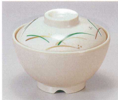
⑥ TA アイボリーストーンつゆ草セット S-1-12 (蓋) ¥5,200 (身) ¥2,500 ¥2,700