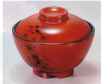
① TA 黄別甲内黒セット S-1-1 (蓋) ¥4,400 (身) ¥1,800 ¥2,600