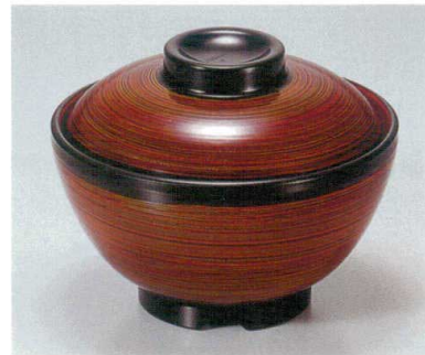
⑦ TA 春慶刷毛目内朱セット S-1-24 (蓋) ¥5,400 (身) ¥2,200 ¥3,200