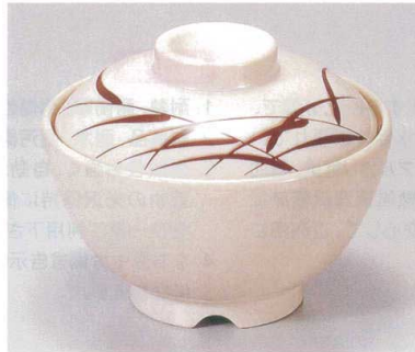
③ TA アイボリーストーン芦セット S-1-5 (蓋) ¥4,700 (身) ¥2,000 ¥2,700