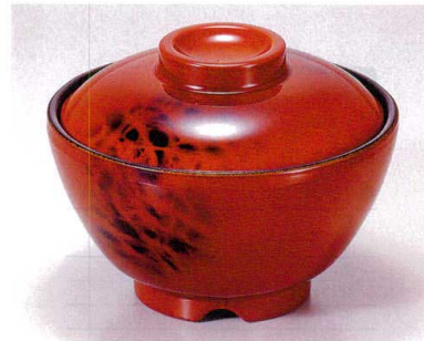
① TA 黄別甲内黒セット S-2-1 (蓋) ¥4,700 (身) ¥1,900 ¥2,800