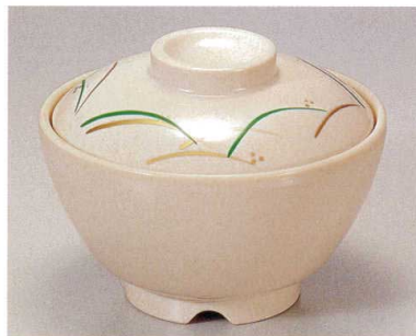
⑥ TA アイボリーストーンつゆ草セット S-2-12 (蓋) ¥5,800 (身) ¥2,900 ¥2,900