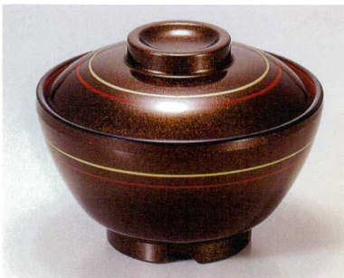
⑤ TA 茶パール朱金ライン内朱セット S-2-22 (蓋) ¥5,600 (身) ¥2,200 ¥3,400