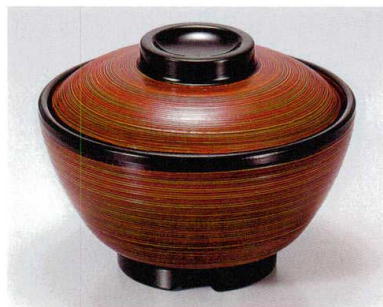
⑦ TA 春慶刷毛目内朱セット S-2-24 (蓋) ¥5,700 (身) ¥2,300 ¥3,400