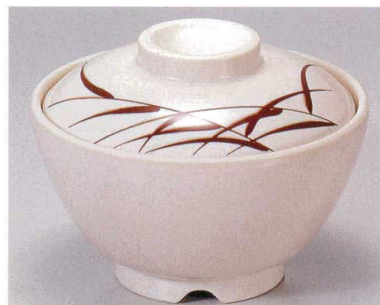
③ TA アイボリーストーン芦セット S-2-5 (蓋) ¥5,100 (身) ¥2,200 ¥2,900