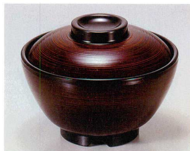
④ TA 溜刷毛目内黒セット S-2-11 (蓋) ¥5,600 (身) ¥2,300 ¥3,300