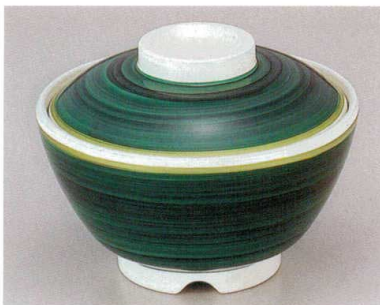
② TA 清流内ストーンセット S-2-7 (蓋) ¥5,000 (身) ¥2,100 ¥2,900