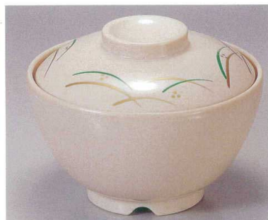
⑥ TA アイボリーストーンつゆ草セット S-3-12 (蓋) ¥6,600 (身) ¥3,200 ¥3,400