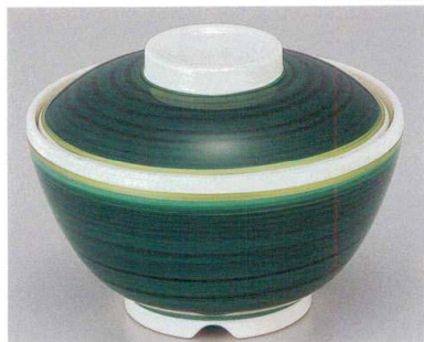
② TA 清流内ストーンセット S-3-7 (蓋) ¥5,900 (身) ¥2,500 ¥3,400