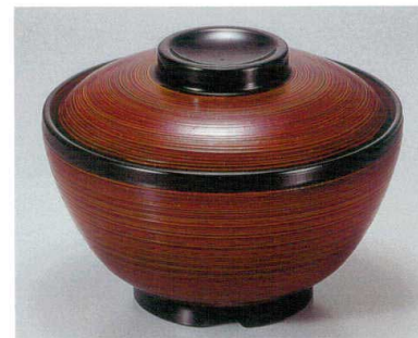
⑦ TA 春慶刷毛目内朱セット S-3-24 (蓋) ¥6,600 (身) ¥2,700 ¥3,900