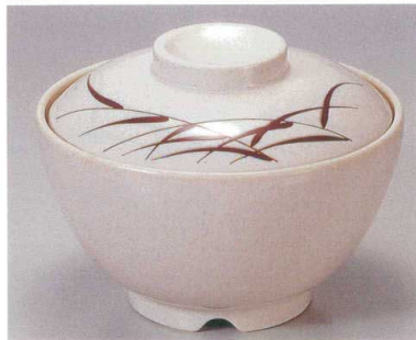
③ TA アイボリーストーン芦セット S-3-5 (蓋) ¥5,900 (身) ¥2,500 ¥3,400