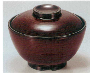
④ TA 溜刷毛目内黒セット S-3-11 (蓋) ¥6,400 (身) ¥2,600 ¥3,800