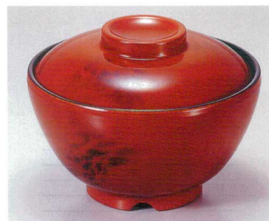
① TA 黄別甲内黒セット S-3-1 (蓋) ¥5,700 (身) ¥2,400 ¥3,300