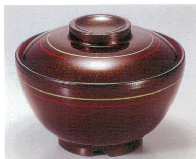
⑤ TA 茶パール朱金ライン内朱セット S-3-22 (蓋) ¥6,600 (身) ¥2,700 ¥3,900