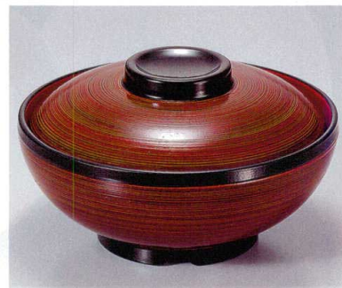
⑦ TA 春慶刷毛目内朱セット S-5-24 (蓋) ¥7,400 (身) ¥2,900 ¥4,500