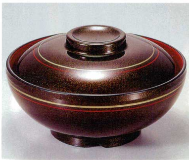
⑤ TA 茶パール朱金ライン内朱セット S-5-22 (蓋) ¥7,000 (身) ¥2,900 ¥4,100