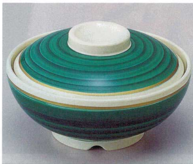
② TA 清流内ストーンセット S-5-7 (蓋) ¥6,700 (身) ¥2,700 ¥4,000