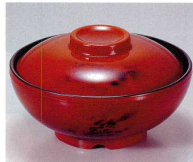
① TA 黄別甲内黒セット S-5-1 (蓋) ¥6,500 (身) ¥2,600 ¥3,900