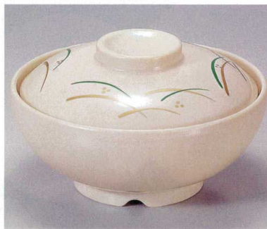
⑥ TA アイボリーストーンつゆ草セット S-5-12 (蓋) ¥7,400 (身) ¥3,800 ¥3,600