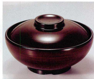
④ TA 溜刷毛目内黒セット S-5-11 (蓋) ¥7,200 (身) ¥2,800 ¥4,400