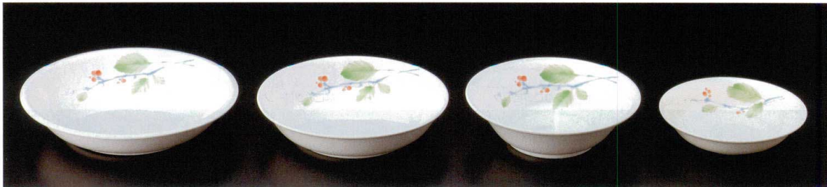
① J-6-97 20.4φ 丸深皿 204φ×41(60) ¥1,920