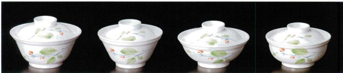
⑤ J-7-2 飯碗(大) 身 148φ×71(40)400ml ¥1,870