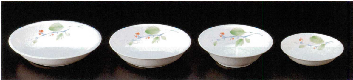
① J-6-97 20.4φ 丸深皿 204φ×41(60) ¥1,920