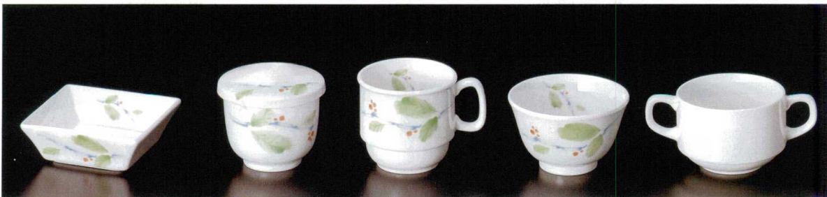
⑰ J-7-14 角深皿 98×36(100) ¥1,800