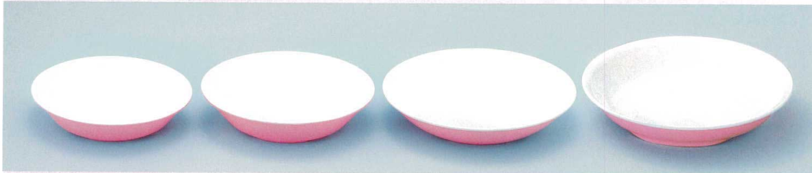
⑨ ST F-17-14-0 深皿(小) 164φ×35(79g・450ml) 重ね寸法:40(160) ¥1,080 ⑩ ST F-18-14-0 深皿(中) 178φ×40(91g・570ml) 重ね寸法:45(160) ¥1,220 ⑪ ST F-20-14-0 深皿(大) 197φ×38(112g・700ml) 重ね寸法:43(100) ¥1,400 ⑫ ST K-22-14-0 カレー皿 219φ×36(135g・830ml) 重ね寸法:43(100) ¥1,730