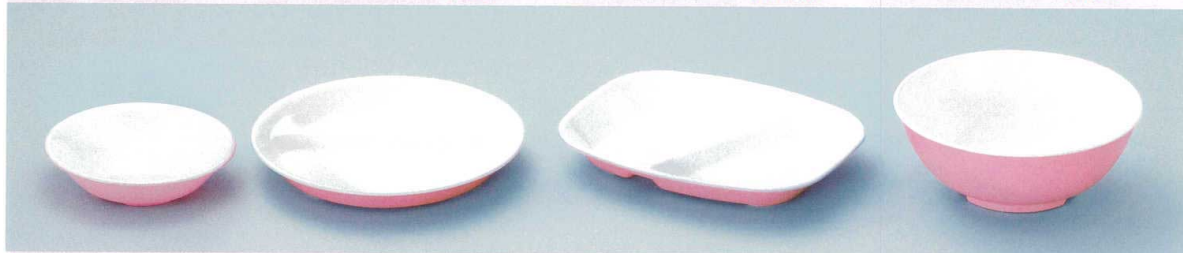
⑤ ST F-13-14-0 小鉢 128φ×32(48g・220ml) 重ね寸法:37(200) ¥810 ⑥ ST C-20-14-0 丸仕切皿 200φ×26(110g・460ml) 重ね寸法:31(160) ¥1,540 ⑦ ST C-22-14-0 角仕切皿 212×173×28(120g・510ml) 重ね寸法:33(100) ¥1,680 ⑧ ST D-18-14-0 うどん丼 180φ×69(125g・1000ml) 重ね寸法:78(100) ¥1,730