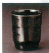
19 J-10-10 長湯呑 那智 [N-JW-15] 67φ×79 (100) 180ml ¥590