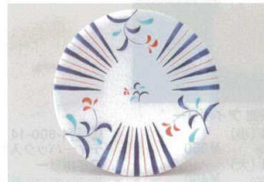
7 1-508-9 寿司皿 小花 150φ×21 (200) ¥750