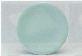
1 1-508-1 寿司皿 青磁 150φ×21 (200) ¥800