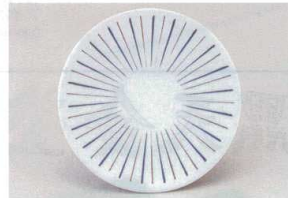
16 1-509-2 寿司皿 花火 150φ×21 (200) ¥750