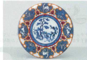
4 1-508-20 寿司皿 山水 150φ×21 (200) ¥850