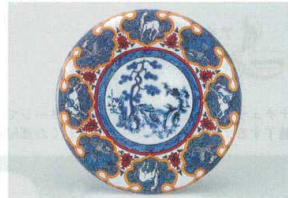
4 1-508-20 寿司皿 山水 150φ×21 (200) ¥850