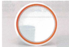
14 1-508-7 寿司皿 オレンジ 150φ×21 (200) ¥750