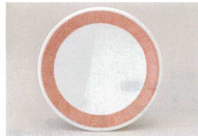
11 1-508-15 寿司皿 ブラウン波 150φ×21 (200) ¥750