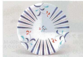
7 1-508-9 寿司皿 小花 150φ×21 (200) ¥750