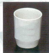
20 W-15-4-3 長湯呑 粉引 [K-JW-15] 67φ×79 (100) 180ml ¥590