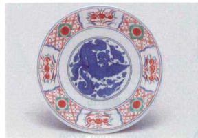
6 O-1-88 寿司皿 鳳凰 150φ×21 (200) ¥770