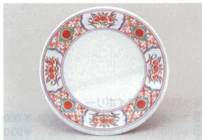
5 1-509-10 寿司皿 赤絵 150φ×21 (200) ¥770