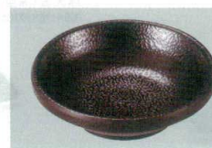
22 S-10-62 いぶし釉小皿 黒 85φ×25 ¥370