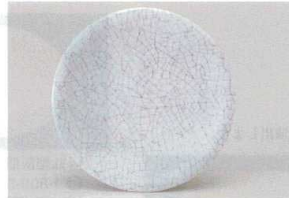
3 1-508-5 寿司皿 石目 150φ×21 (200) ¥750