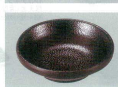
22 S-10-62 いぶし釉小皿 黒 85φ×25 ¥370