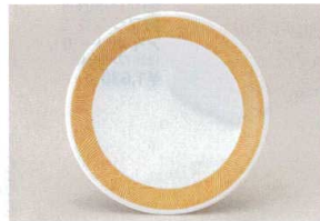
10 1-508-14 寿司皿 イエロー波 150φ×21 (200) ¥750