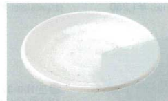
21 K-6-4-3 小皿 粉引 [K-JW-6] 96φ×13 (250) ¥380