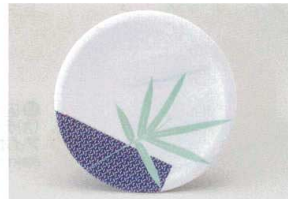
12 1-508-10 寿司皿 青笹 150φ×21 (200) ¥750