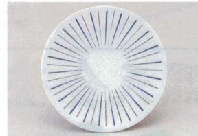
16 1-509-2 寿司皿 花火 150φ×21 (200) ¥750