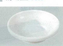
23 S-10-64 いぶし釉小皿 粉引 85φ×25 ¥370