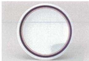
13 1-508-6 寿司皿 ブルー 150φ×21 (200) ¥750