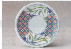
8 1-509-3 寿司皿 みのり 150φ×21 (200) ¥750