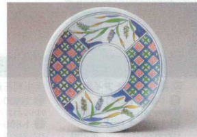
8 1-509-3 寿司皿 みのり 150φ×21 (200) ¥750