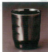
19 J-10-10 長湯呑 那智 [N-JW-15] 67φ×79 (100) 180ml ¥590