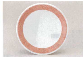
11 1-508-15 寿司皿 ブラウン波 150φ×21 (200) ¥750