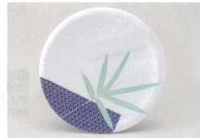
12 1-508-10 寿司皿 青笹 150φ×21 (200) ¥750