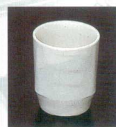
20 W-15-4-3 長湯呑 粉引 [K-JW-15] 67φ×79 (100) 180ml ¥590