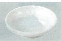
23 S-10-64 いぶし釉小皿 粉引 85φ×25 ¥370