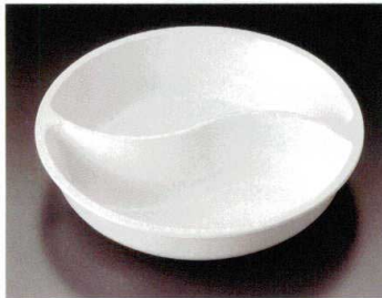
① M-19-76 ツインボール アイボリー 195φ×30(60) ¥1,700

中華の点心入れや鍋料理の具材入れに最適のメラミン製ツインボール。 洗浄機および消毒保管庫にも対応。 安心の日本製。