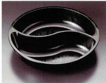
② M-19-77 ツインボール 黒 195φ×30(60) ¥1,700