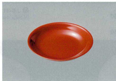
⑥ J-7-38 取皿 朱 [W-63] 135φ×22(200) ¥530