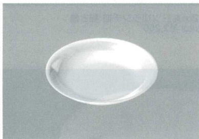
⑤ J-7-37 取皿 アイボリー [W-63] 135φ×22(200) ¥530