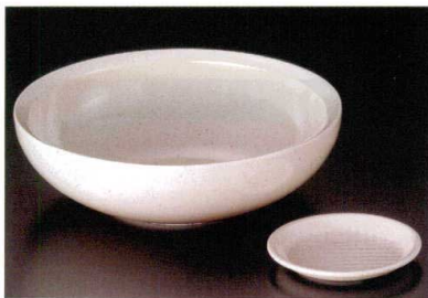
⑨ J-6-81 8寸多用丼 粉引 239φ×75(30) ¥4,000