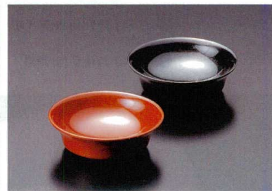
⑦ F-300-11-6 しその実入れ黒 [F-30] 57φ×18(500) ¥230