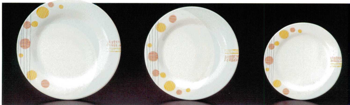
① J-6-4 25cmディナー皿 [W-JW-500] 249φ×25 (30) ¥2,400