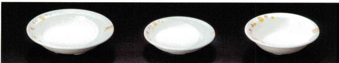
⑥ J-6-9 17.5cmクープ皿 [W-JW-505] 175φ×38 (60) 580ml ¥1,700