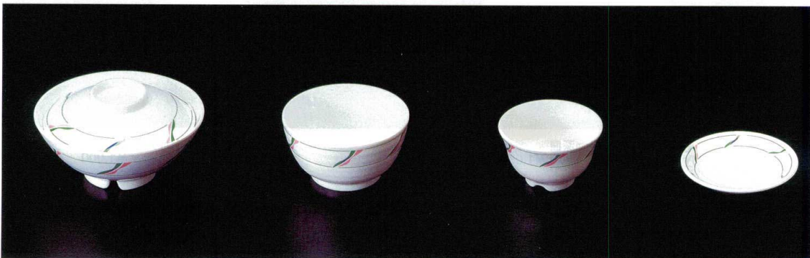
④ P-116 飯碗(身) [P-YW-116] 146φ×61(60) 490ml ¥2,350