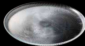
New CS-8691 ジェスト プレート26 ¥2,200 ★φ260×H14 (6) <TR>