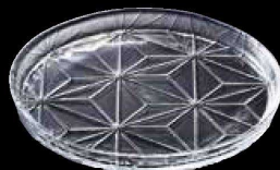
QW-5785 FLP 24cmプレート ¥2,700 φ235×H20 (6) <TR>