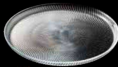
New CS-8690 ジェスト プレート21 ¥1,300 ★φ215×H14 (6) <TR>