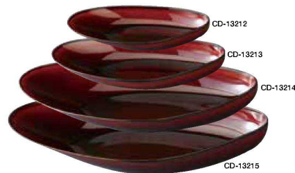
バイバルブ 白磁 <JP> CD-13212 ムール 18 ペｯ甲 ¥1,300 180×88×H25 CD-13213 ムール 22 ペｯ甲 ¥2,150 225×110×H32 CD-13214 ムール 32 ペｯ甲 ¥3,800 320×154×H43 CD-13215 ムール 36 ペｯ甲 ¥4,850 365×180×H52