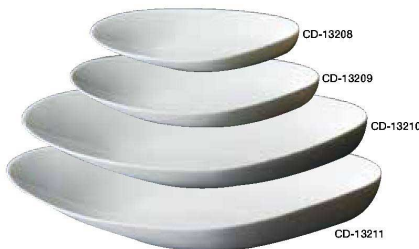
バイバルブ 白磁 <JP> CD-13208 ムール 18 白 ¥1,300 180×88×H25 CD-13209 ムール 22 白 ¥2,150 225×110×H32 CD-13210 ムール 32 白 ¥3,800 320×154×H43 CD-13211 ムール 36 白 ¥4,850 365×180×H52