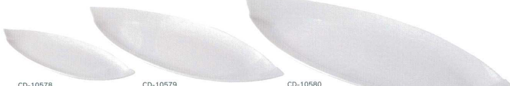
CD-10578 ミケル 2.1cm長皿 ¥1,500 210×80×H22 白磁 <JP>