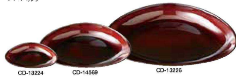
CD-13224 CD-14569 CD-13226 バイバルブ 白磁 <JP> CD-13224 クラム 10 ペｯ甲 ¥860 100×90×H20 CD-14569 クラム 18 ペｯ甲 ¥1,850 180×162×H31 CD-13226 クラム 26 ペｯ甲 ¥4,300 255×234×H40