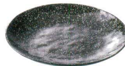
QU-6867 ビュッフェディッシュ ラウンド 26 スパークシルバー ¥2,700 φ260×H33 <CN>