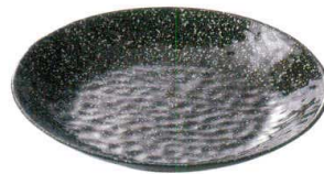
QU-6868 ビュッフェディッシュ ラウンド 30 スパークシルバー ¥3,500 φ300×H40 <CN>