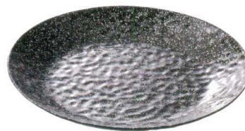
QU-6869 ビュッフェディッシュ ラウンド 36 スパークシルバー ¥4,000 φ360×H42 <CN>