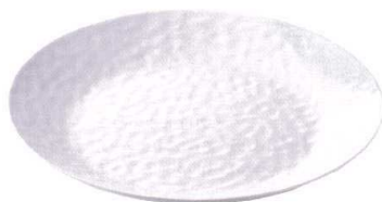
QU-6866 ビュッフェディッシュ ラウンド 36 ホワイト ¥3,100 φ360×H42 <CN>