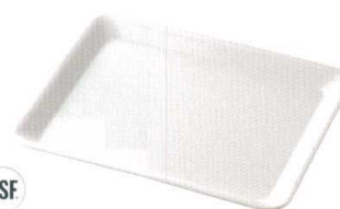
MF SAFETY 2000 NSF CR-3579 ハルサム パン1/2 パーパリアンクリーム ¥3,400 323×263×H25 (6) <CN>