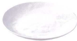
QU-6864 ビュッフェディッシュ ラウンド 26 ホワイト ¥2,380 φ260×H33 <CN>