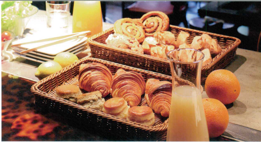
Buffet & Displayware