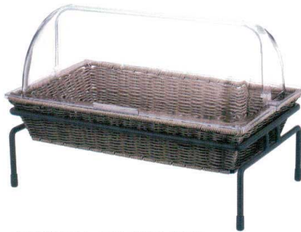
丸材&平材ミックス ステンレスワイヤー補強入り