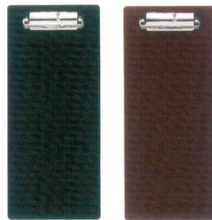
ブラック ブラウン 伝票クリップ M PVC <JP> QW-3173 ブラック ¥480 100×235 QW-3175 ブラウン ¥480 100×235