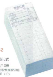
QW-4162 会計伝票 複写切り取り式 ¥3,800/10冊 85×200 1冊2枚複写50組 (10×10)紙 <JP>