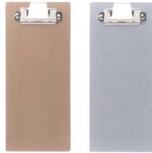
ゴールド シルバー New プラストロングバインダー <JP> QW-8287 ゴールド ¥670 90×205 QW-8288 シルバー ¥670 90×205