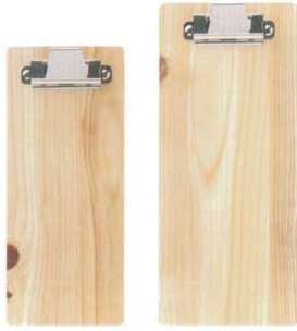
85×200 100×230 New プラ両面白木タイプバインダー <JP> QW-8290 85×200mm ¥750 85×200 QW-8289 100×230mm ¥870 100×230