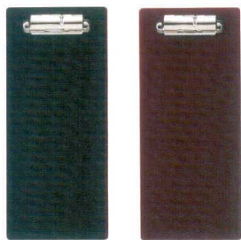
ブラック ブラウン 伝票クリップ S PVC <JP> QW-3177 ブラック ¥460 90×210 QW-3185 ブラウン ¥460 90×210