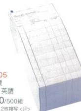
QX-4405 会計伝票 横のり 英語 ¥4,100/500組 80×175 2枚複写 <JP>