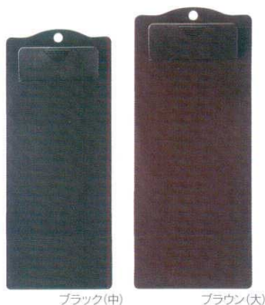
ブラック(中) ブラウン(大) 成型バインダー 小 ABS <CN> QW-2866 ブラック ¥340 90×165 QW-2868 ブラウン ¥340 90×165 成型バインダー 中 ABS <CN> QW-2870 ブラック ¥370 90×220 QW-2871 ブラウン ¥370 90×220 成型バインダー 大 ABS <CN> QW-2873 ブラック ¥400 100×238 QW-2874 ブラウン ¥400 100×238