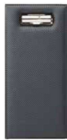
QW-4533 カーボンタイプ 伝票ホルダー ブラック ¥1,600 115×235 PVC <JP> 左ポケット付