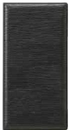
QW-3086 レザータッチ グループ伝票ホルダー S ブラック ¥1,200 103×200 (1×10) PVC <JP>