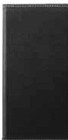
QW-4535 マグネット式 伝票はさみ 二つ折 黒 ¥1,700 110×220 PVC <CN> 左ポケット付