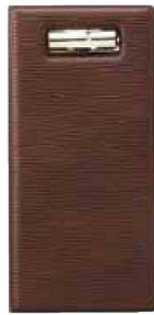
QW-3080 レザータッチ グループ伝票ホルダー M ブラウン ¥1,600 115×235 (1×10) PVC <JP>