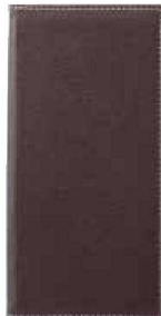
QW-4536 マグネット式 伝票はさみ 二つ折 茶 ¥1,700 110×220 PVC <CN> 左ポケット付