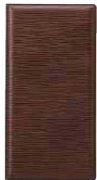
QW-3084 レザータッチ グループ伝票ホルダー S ブラウン ¥1,200 103×200 (1×10) PVC <JP>