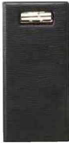
QW-3083 レザータッチ グループ伝票ホルダー M ブラック ¥1,600 115×235 (1×10) PVC <JP>