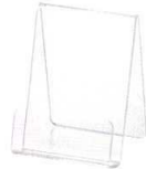
QW-5432 ショップカードスタンド アクリル タテ ¥600 60×60×H85 挟み幅15mm PMMA <TW>