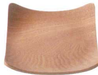
New QX-8325 ノンスリップカーブコースター120 ウィロー ¥600 120×120×H25(6×40)ウレタン塗装<CN>