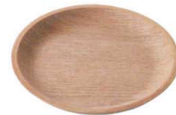
New QX-8324 ノンスリップコースター120 ウィロー ¥550 φ120×H12(6×24)ウレタン塗装<CN>