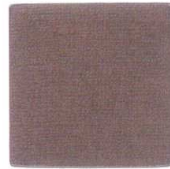
New QW-8534 トープ コースター(DB) ¥600/4枚 107×107 PU <CN>