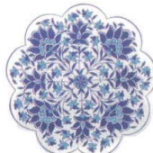
DG-4507 イズニック コースター 04 ¥720 φ110×H7(2)本体陶器 裏EVA <TR>