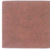
New QW-8533 トープ コースター(BR) ¥600/4枚 107×107 PU <CN>