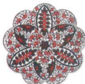
DG-4506 イズニック コースター 03 ¥720 φ110×H7(2)本体陶器 裏EVA <TR>