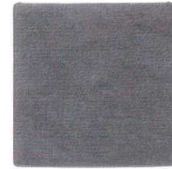
New QW-8535 トープ コースター(BK) ¥600/4枚 107×107 PU <CN>