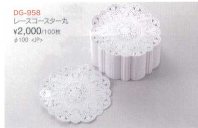
DG-958 レースコースター丸 ¥2,000/100枚 φ100 <JP>