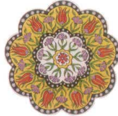
DG-4505 イズニック コースター 02 ¥720 φ110×H7(2)本体陶器 裏EVA <TR>