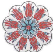
DG-4508 イズニック コースター 05 ¥720 φ110×H7(2)本体陶器 裏EVA <TR>