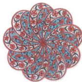
DG-4504 イズニック コースター 01 ¥720 φ110×H7(2)本体陶器 裏EVA <TR>