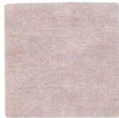
New QW-8532 トープ コースター(GY) ¥600/4枚 107×107 PU <CN>