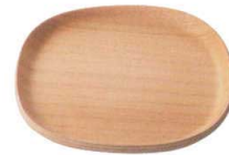
New QX-8317 ユニティ ノンスリップソーサー125 メイプル ¥600 125×125×H10(6×12)ウレタン塗装<CN>