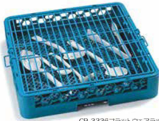
CR-3336フラットウェアラック などに取付可能なワイヤー蓋です。

CR-3317 オプティクリーン ホールドダウングリッド ¥8,600 452×452×H76 (6) SUS <US>