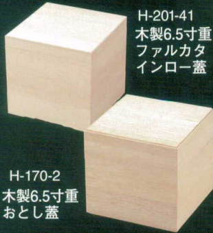
H-201-41 木製6.5寸重 ファルカタ インロー蓋