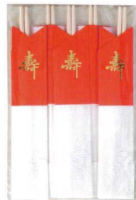
J7-88-7 H-174-47 祝箸 紅白 (5膳入) (24×13.3) ¥450 40g