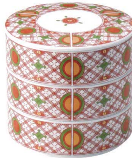
J7-88-6 有田焼 丸重 錦古伊万里 直送 H-156-90 1段 ¥2,500 (15.6φ×5.9) H-156-90A 2段 ¥4,000 (15.6φ×10.5) H-156-90B 3段 ¥5,500 (15.6φ×15) 親の内寸(14.1φ×3.8) 蓋230g 親500g