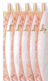
J7-88-9 H-161-32 祝箸 花友禅 (5膳入) (24×13.3) ¥940