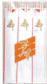
J7-88-8 H-174-49 祝箸 松竹梅 (5膳入) (24×13.3) ¥420 40g