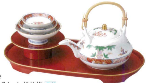
J7-88-4 H-156-92 A 有田焼 有田焼おとそセット 松竹梅 直送 ¥46,000