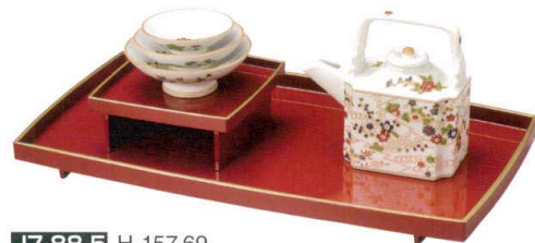
J7-88-5 H-157-69 有田焼 有田焼おとそセット 流水梅 直送 ¥40,000