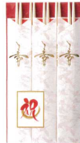
J7-88-10 H-161-33 祝箸 舞鶴 (5膳入) (24×13.3) ¥940