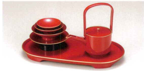
J7-88-2 M-10-10 小判おとそセット 朱天金 (化粧箱付) 箱寸(36×20×20.5) ¥10,200