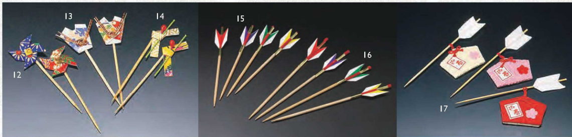
ブチピック (5本入) 12 (25840) 風車 170円(1本当り34円) 約L7.5cm 13 (25839) のし 210円(1本当り42円) 約L8.5cm 14 (25838) 結び 210円(1本当り42円) 約L9cm ※各色混合