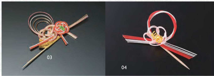
水引飾り 祝い梅 (ピック付) (50本入) 03 (26268) 9,500円(1本当り190円) 約7×L12.3cm