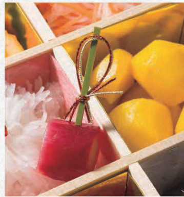
水引祝い飾り (楊枝付) 梅 (50本入) 04 (25746) 9,000円(1本当り180円) 約5.5×L9.2cm