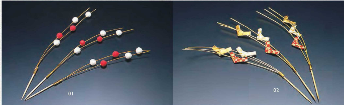
水引もち花ピック (20本入) 01 (25879) 4,400円(1本当り220円) 約L21.5cm