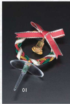
水引クリスマスピック リース (5本入) 01 (25688) 800円 約5×L8cm (1本当り160円)