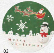
紙コースタークリスマス 丸 (100枚入) 03 (16260) 2,000円 約φ9×t0.08cm (1枚当り20円)