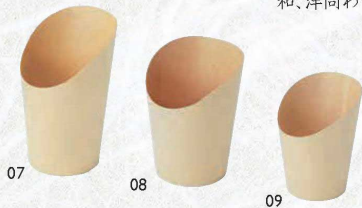
紙スナックカップ (50ヶ入) NEW 07 (08997) 大 1,900円 (1ヶ当り38円) 約φ8.4×H13(底φ6)cm 08 (08998) 中 1,700円 (1ヶ当り34円) 約φ8.2×H10.7(底φ6)cm 09 (08999) 小 1,400円 (1ヶ当り28円) 約φ7.5×H9.5(底φ5)cm ※材質:未晒紙(内面PE)

一人前を盛りつけて、テイクアウトに。スティック状のお菓子や串もの、ご飯ものまで、和、洋問わず使える紙カップです。