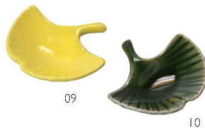
新・イチヨウ型珍味皿 09 (27773) 黄 540円 10 (27774) 緑 540円 約7×6.5×H1.8cm