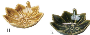
陶器・カエデ珍味入 11 (27876) 黄瀬戸 390円 12 (27875) 織部 390円 約8×8.5×H2.9cm