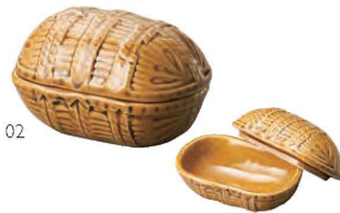
蓋付米俵珍味入 02 (26355) 1,000円 約7×4.5×H4.5cm ※輸入陶器 (小箱10ヶ入)