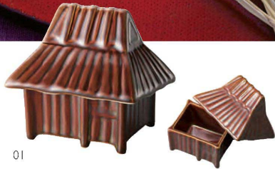
蓋付田舎家小付 01 (26354) 1,200円 約9×7.5×H9cm/内寸約6×4.5×H3.2cm ※輸入陶器 (小箱1ヶ入)