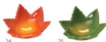
新・もみじ型珍味入 24 (27764) 赤 410円 25 (27765) 緑 410円 約7×6×H3.5cm ※輸入陶器 (小箱10ヶ入)