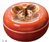
新柿型珍味入 14 (27676) 630円 約φ6.3×H4.5cm ※内側の色：蓋/橙 身/白 ※輸入陶器 (小箱10ヶ入)