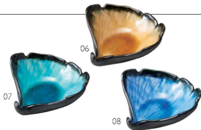
銀杏小付 06 (27799) 茶 820円 07 (27801) 深緑 (ふかみどり) 820円 08 (27800) 深青 (しんせい) 820円 約8.8×9.2×H4.1cm