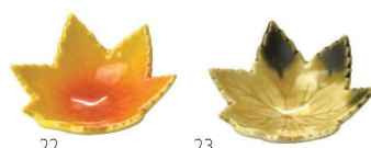
新・もみじ型珍味入 22 (27762) 黄 410円 23 (27763) 織部 410円 約7×6×H3.5cm ※輸入陶器 (小箱10ヶ入)