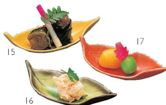
木の葉型珍味入 15 (26389) 黄 550円 16 (26390) フリット 550円 17 (26391) 朱赤 550円 約9×4×H2.2cm