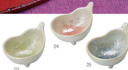
ナス型ラスター珍味入 03 (27918) ヒワ 850円 04 (27917) ピンク 850円 05 (27919) ルリ 850円 約6.2×8.2×H4.9cm