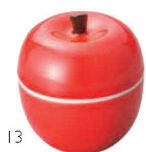
りんご珍味入 13 (27758) 660円 約φ5.2×H5.8cm ※内側の色：赤 ※輸入陶器 (小箱10ヶ入)