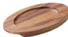
A34 00 003 楕円受台 S [TH] L-24 S-14.2 H-1.8 (内寸 15.5×9.5) ¥3,400 材質：アカシア