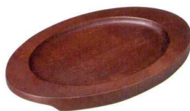
A34 00 002 楕円受台 M [VN] L-26.5 S-17 H-1.8 (内寸 18.5×12.5) ¥4,100 材質：ラバーウッド