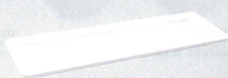
M20 00 071 シルビアホワイト 53cm細長角プレート [CN] L-53 S-17.7 H-2.8 ¥5,000