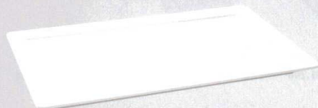
M20 00 047 シルビアホワイト 53cm長角プレート [CN] L-53 S-32.5 H-2.8 ¥7,000