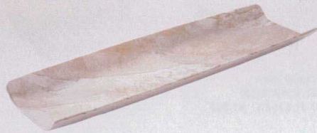
M21 70 071 ソフィアベージュ 53cm細長角トレイ [CN] L-53 S-16.2 H-4 ¥4,000