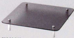
G25 30 960 スモーク 35cmディスプレイスタンド [TR] D-34.9 H-6.8 ¥18,000