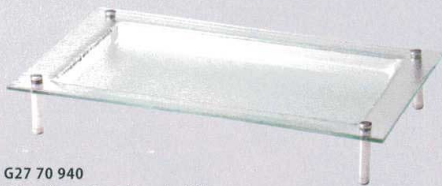
G27 70 940 53cmビュッフェプレート [TR] L-52.7 S-32 H-8.6 ¥19,000