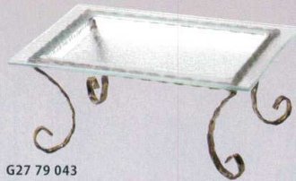
G27 79 043 40cmビュッフェスタンド [TR] L-39.8 S-30 H-16.8 ¥22,000