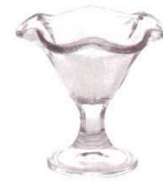
G57 00 011 プリマベラ 240cc [IT] D-13.5 H-13.7 C-240cc ¥2,300