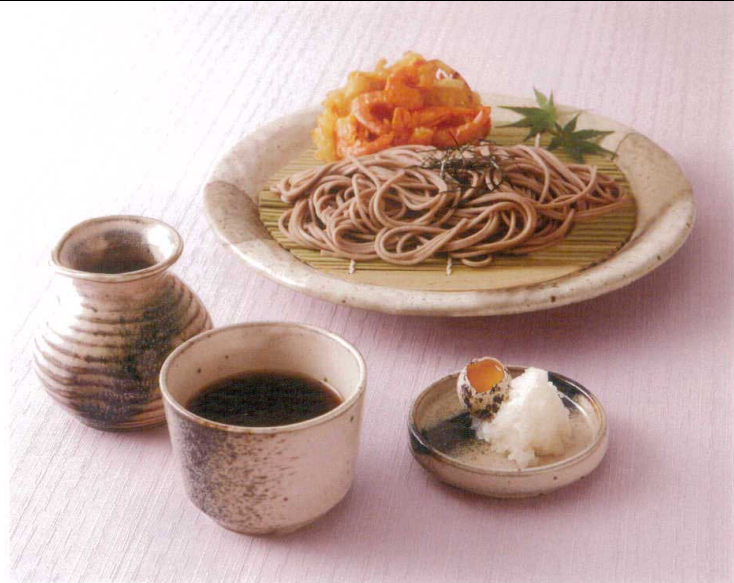
■竹製すのこ 丸 19.5cm ■銀河 1合徳利 ■銀河 そば猪口 ■銀河 3.0薬味皿